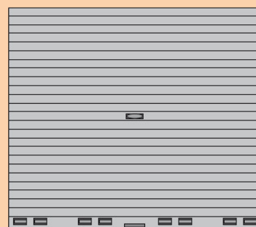
Horizontale doorsnee met en zonder afstandsbediening